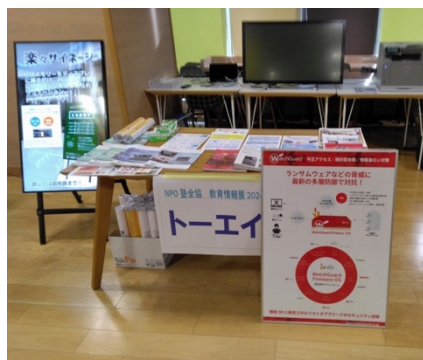
MS XHB(電子黒板の最新版)