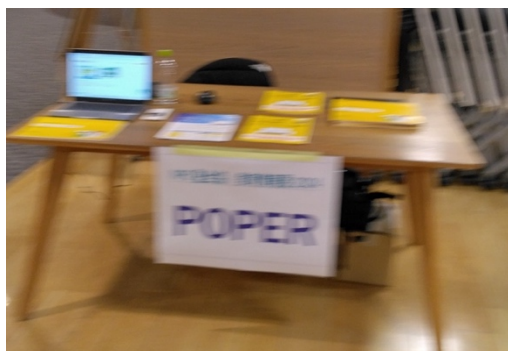
スクール運営に必要な機能がオールラ ウンドで搭載。