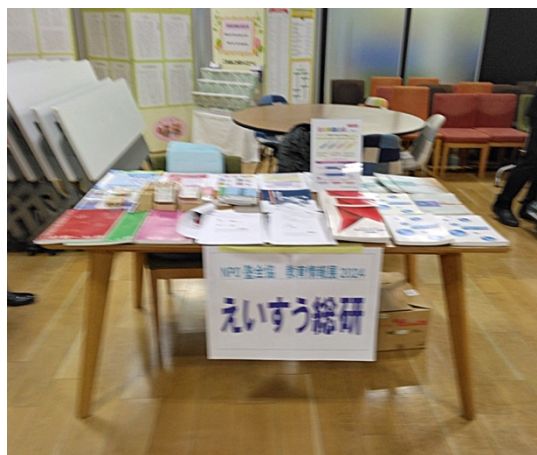
単語塾のリニューアル(英検に合わせてある) * 英検は準1級までである。