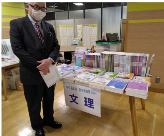
中学生ワーク(必修テキスト) 改定 Winpass の理科社会がカラー化