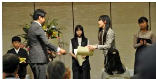
←読書作文コンクールの受賞者表彰