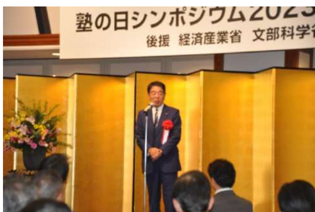
衆議院議員 下村博文氏