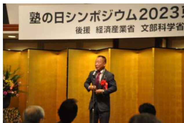
参議院議員大島九州男氏